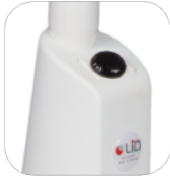
Infrarouge sans contact