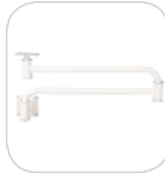
Bras mural articulé