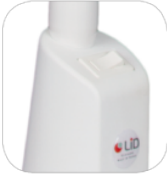
Classique à bascule