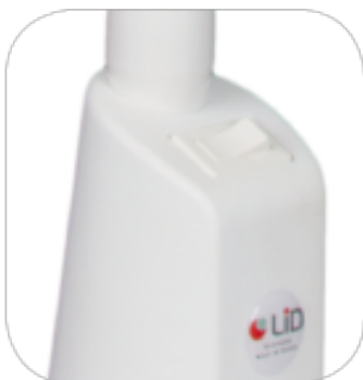
Classique à bascule

Il existe deux types d'interrupteurs au choix pour ce modèle : classique à bascule ou infrarouge sans contact.