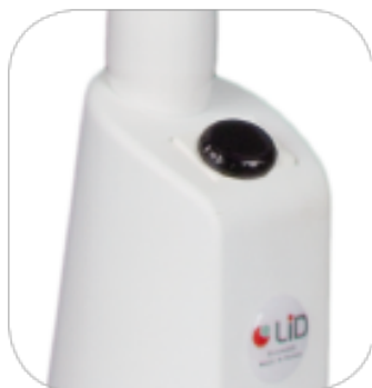
Infrarouge sans contact

La lampe est livrée seule , choisissez l' option de fixation qui vous convient le mieux :