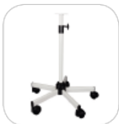
Pied à roulettes télescopique lesté

La lampe est livrée seule , choisissez l' option de fixation qui vous convient le mieux :