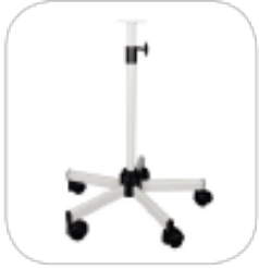
Pied à roulettes télescopique lesté