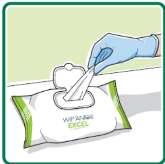
Prendre une lingette